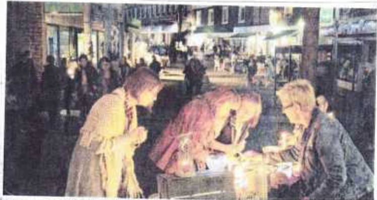
Schönes Ambiente: Beim Nachtflohmarkt des Kinderschutzbundes konnten Schnäppchenjäger gemütlich in der Fußgängerzone flanieren.

Herdecke. Der Kinderschutzbund (KSB) lädt am Freitag, 6. Mai, von 18 bis 23 Uhr in der Herdecker Fußgängerzone zu einem Nachtflohmarkt ein. An 40 Ständen bieten Hobbytrödler und Gewerbetreibende Kunst und Krempel, Antiquitäten und Kurioses. Der KSB ist als Veranstalter mit einem Informationsstand vertreten.