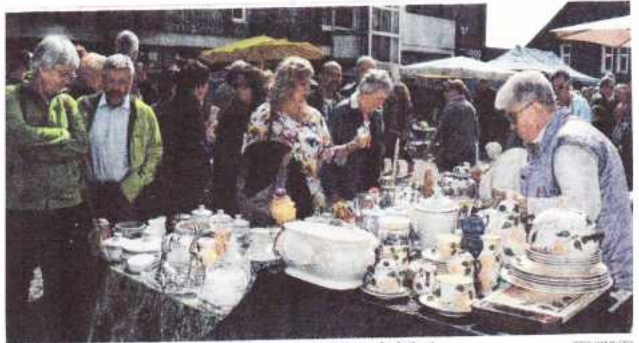
Porzellan, Glas, Bücher, Schmuck: Der Flohmarkt rund um das Rathaus boomt mit seinem großen Sottiment.

Herdecke. Im Rahmen des Herdecker Frühlingsfestes veranstaltet der Kinderschutzbund (KSB) Herdecke am Sonntag, 10. April, wie schon in den Vorjahren von 11 bis 18 Uhr rund um das Herdecker Rathaus einen Antik- und Trödelmarkt. An über 50 Ständen bieten Hobbytrödler und Gewerbetreibende „Kunst und Krempel, Antiquitäten, Kurioses und Köstliches“ an. Der KSB ist mit einem Stand vertreten, an dem mit dem Glücksrad Kleinspielzeug verlost wird. Der Kinderschutzbund hofft, dass am Sonntag wieder viele Besucher zum Rathaus kommen.