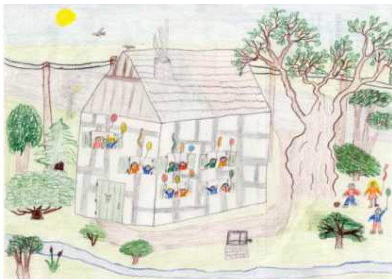
„Haus mit fröhlichen Kindern“ von Constantin Latagahn