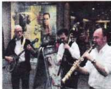
Für flotte Rhythmen sorgen unter anderem die drei Herren von Jazzbaguette.

Wie wäre es mit einem Glas Wein, würzigem Käse und frischem Baguette? Oder soll es doch lieber ein köstliches Stück Flammhachs sein. Die Entscheidung wird schwer werden am kommenden Wochenende, wenn die Genießertage wieder mit den schmackhaftesten Köstlichkeiten locken.