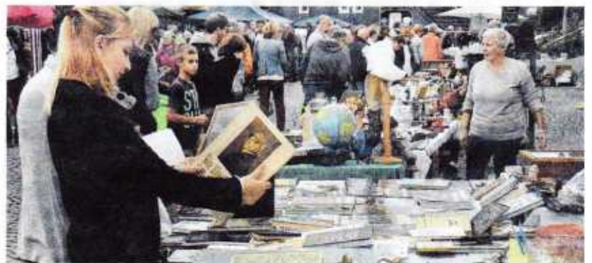
Bei Händlern und Trödlern in der Region ist der Antik- und Trödelmarkt, organisiert vom Kinderschutzbund, durchaus bekannt. Immer mehr Besucher sind es in den letzten Jahren geworden. Mittlerweile reicht der Platz vor dem Rathaus fast nicht mehr.