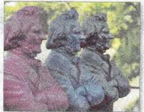
Insgesamt standen 128 Skulpturen - 51 rote, 51 blaue und 26 graue - zur Verfügung.

Wesentliche Spenden wurden durch folgende Firmen bzw. Personen erbracht: Sparkasse Wetter, Stadtmarketing Wetter, Firma