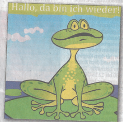
Das Programmheft zum Ferienfrosch liegt ab sofort im Rathaus und vielen anderen Stellen aus.

Zwei ganze Seiten des Hefes füllt das Jugendferienprogramm mit diversen Aktionen und Ausflügen. Nicht nur Kartfahren in Wuppertal, der Starlight Express in Bochum oder Skifahren in Neuss stehen auf der Liste. Natürlich