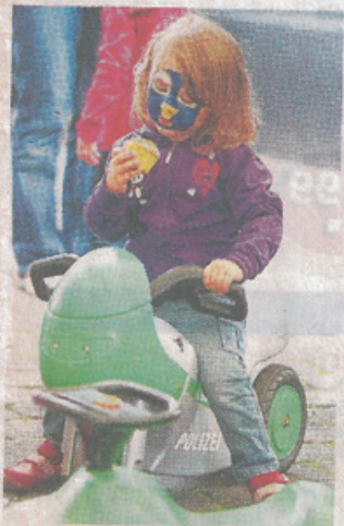
35 Jahre Kinderschutzbund in Herdecke