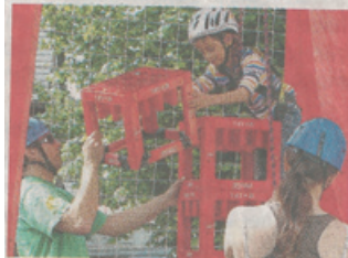
Eine geht noch beim Kletterspaß auf Kisten.

Herdecke. Die einen schürften nach Gold, die anderen bastelten Gespenster für den Garten: Zum Abschluss der Maiwoche gab's eine „kreative Straße“ in der Herdecker Innenstadt. Viele Familien kamen mit ihrem Nachwuchs und ließen sich von den Mitarbeitern der städtischen Jugendzentren auf neue Ideen bringen. Kinderschutzbund, DEW 21, die evangelischen Kirchengemeinden und der Waldorfkindergarten hatten ebenfalls Stände. Auch weil das Wetter mitspielte, war der Abschluss der diesjährigen Maiwoche gut besucht.